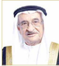
الشيخ محمد بن عبدالله