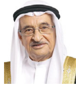
الشيخ محمد بن عبدالله آل خليفة

أكد رئيس المجلس الأعلى للصحة الفريق طبيب الشيخ محمد بن عبدالله آل خليفة، ما حققه الحرس الوطني من إنجازات منذ تأسيسه بما يسهم في رفد مسارات التنمية لتحقيق أهداف المسيرة التنموية الشاملة بقيادة حضرة صاحب الجلالة الملك حمد بن عيسى آل خليفة عاهل البلاد المفدى القائد الأعلى، وما يشهده من تطور لرفع مستوى جاهزية والاستعداد لتلبية نداء الواجب بالتكاتف والتكامل مع قوة دفاع البحرين حصن الوطن المنيع وكافة القوى الأمنية. ورفع الشيخ محمد بن عبدالله آل خليفة، التهانى لحضرة صاحب الجلالة عاهل البلاد المفدى القائد الأعلى، وإلى صاحب السمو الملكي الأمير سلمان بن حمد آل خليفة ولي العهد نائب القائد الأعلى رئيس مجلس الوزراء، وإلى