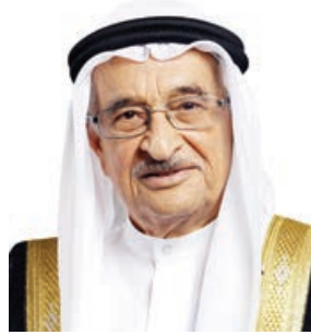
○ رئيس المجلس الأعلى للصحة.

وأعرب الشيخ محمد بن عبدالله آل خليفة عن خالص تهانئه لسمو رئيس الحرس الوطني وكافة المنتسبين اليواسل، بما قدموه من جهود من أجل رفع راية الوطن وتعزيز استقراره، متمنياً للحرس الوطني المزيد من التقدم والازدهار لتحقيق أهدافه المنشودة في ظل العهد الزاهر لجلالة الملك المفدى.