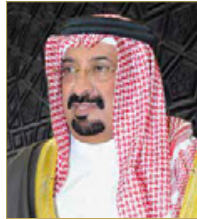
الشيخ أحمد بن علي

الوطني من إنجازات منذ تأسيسه بما يسهم في رقد مسارات التنمية لتحقيق أهداف المسيرة التنموية الشاملة بقيادة جلالة ملك البلاد، وما يشهده الحرس الوطني من تطور لرفع مستوى الجاهزية والاستعداد لتلبية نداء الواجب بالتكاتف والتكامل مع قوة دفاع البحرين حصن الوطن المنيع وكافة القوى الأمنية رافعا أسمى آيات التهاني والتبريكات إلى جلالة الملك وإلى صاحب السمو الملكي ولي العهد نائب القائد الأعلى رئيس مجلس الوزراء، وإلى رئيس الحرس الوطني، الفريق أول ركن سمو الشيخ محمد بن عيسى آل خليفة.