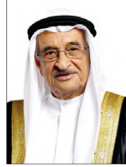
الفريق طبيب الشيخ محمد بن عبدالله

رفع الفريق طبيب الشيخ محمد بن عبدالله آل خليفة رئيس المجلس الأعلى للصحة أسمى آيات التهناني والتبريكات لحضرة صاحب الجلالة الملك حمد بن عيسى آل خليفة عاهل البلاد المفدى القائد الأعلى حفظه الله ورعاه، وإلى صاحب السمو الملكي الأمير سلمان بن حمد آل خليفة ولي العهد نائب القائد الأعلى رئيس مجلس الوزراء حفظه الله، وإلى الفريق أول ركن سمو الشيخ محمد بن عيسى آل خليفة رئيس الحرس الوطني، بمناسبة الذكرى الخامسة والعشرين لتأسيس الحرس الوطني. وأشاد بالجهود الكبيرة التي يبذلها منتسبو هذا الصرح العسكري الوطني، وبدورهم المشهود في تعزيز أسس الامن والاستقرار ضمن المنظومة الأمنية