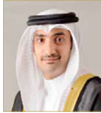
الشيخ عبدالله بن خليفة

ورفع رئيس مجلس إدارة شركة الاتصالات السلكية واللاسلكية "بتلكو" الشيخ عبدالله بن خليفة آل خليفة، أبلغ التهاني والتبريكات إلى مقام عاهل البلاد صاحب الجلالة الملك حمد بن عيسى آل خليفة، وإلى ولي العهد رئيس مجلس الوزراء صاحب السمو الملكي الأمير سلمان بن حمد آل خليفة، بهذه المناسبة، معرباً عن اعتزازه بالدور الذي طلع به الحرس الوطني والقدرات والكفاءات التي تقدم كل غالي ونفيس لحفظ أمن الوطن واستقراره، معاهدن الله على الذود عن تراب هذا الوطن الغالي وحماية أمن الوطن واستقراره، ومكتسباته الحضارية والتنموية التي تحققت في ظل العهد الزاهر لقيادة جلالة الملك. وأكد أن جهود جلالتهم ساهمت في ترسيخ مكانة الحرس الوطني كحصن